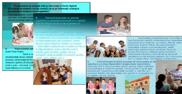
Figura 3. Tipuri de comunicare