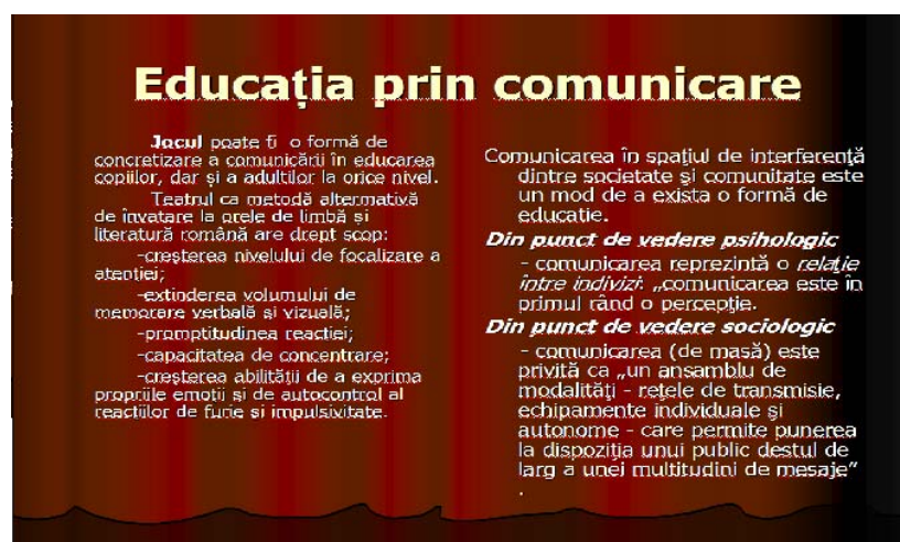
Figura 1. Educație/ Comunicare

Comunicarea (...) este cea care asigură dispoziții emoționale și intelectuale asemănătoare, moduri similare de a răspunde la așteptări și cerințe.” (Apud Paul Dobrescu)