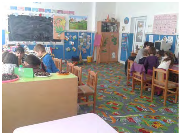
Lucru la centre