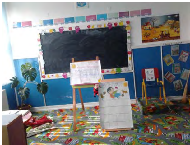
Calendarul lunii, flipchartul si scaunul autorului