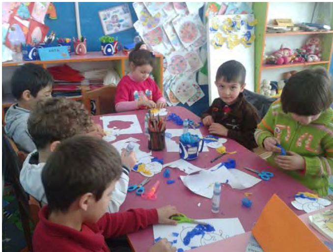
Activitate la centrul de Artă