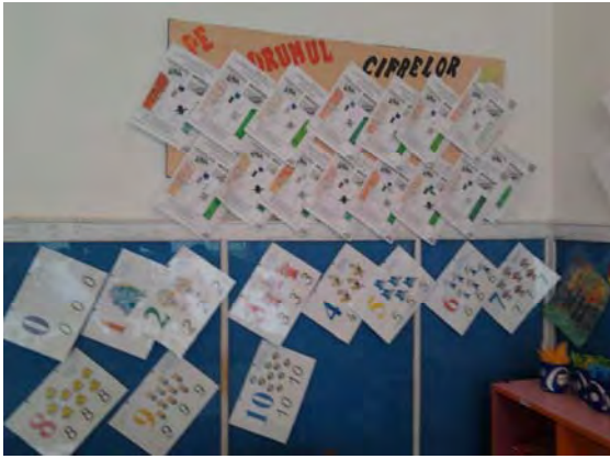
Panoul de Matematică