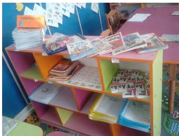
Centrul de Comunicare