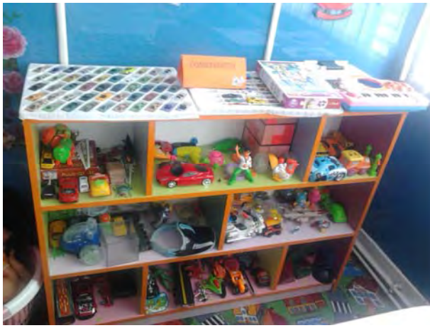
Centrul de Constructii