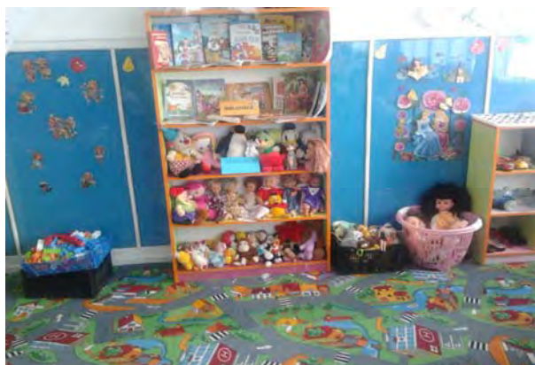
Biblioteca si Ludoteca