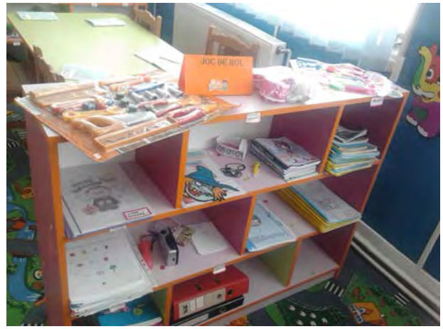
Centrul de Joc de Rol