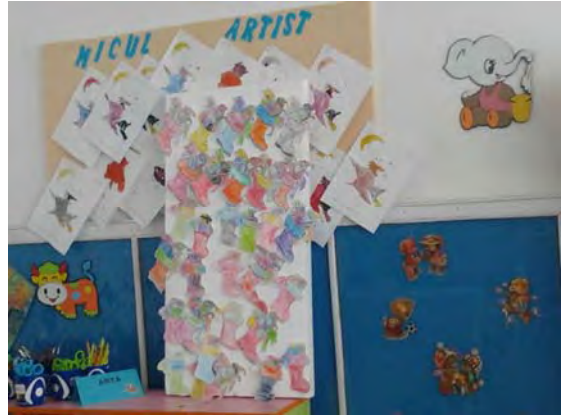
Panoul de Artă