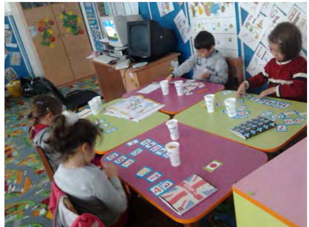
Activitate de Matematica si Explorarea Mediului