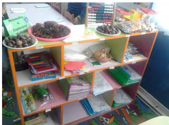
Centrul de Matematica si Explorarea Mediului