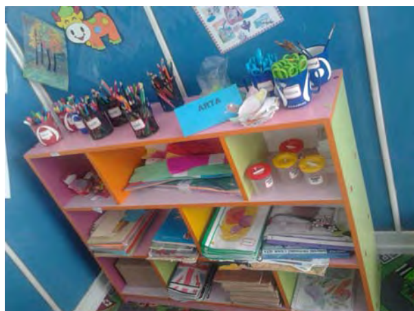
Centrul de Arta