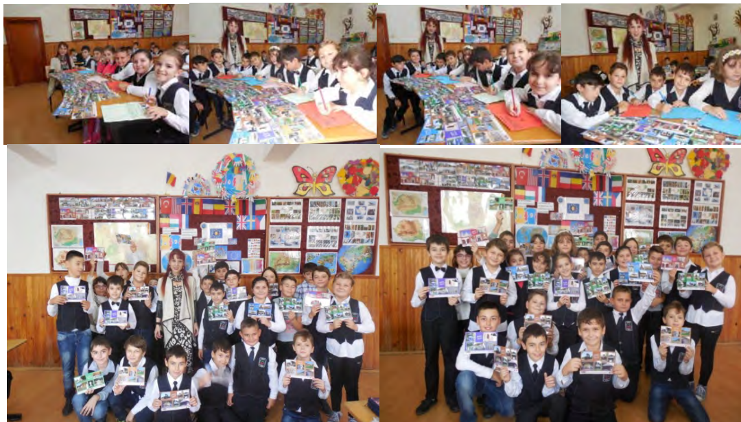
Proiect internațional eTwinning- „eCultural Kaleidoscope” Schimb de cărți poștale cu partenerii de proiect – noiembrie 2015