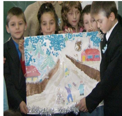
Grupa jocurilor de iarnă