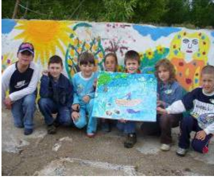
Grupa nr. 5-,, Flori”