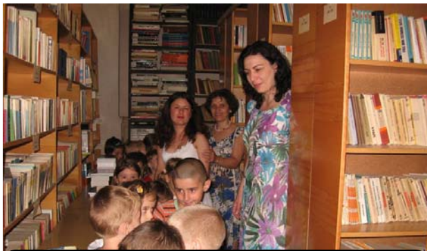
„PRIERENII CĂRȚILOR”-vizită la Bibiloteca ISJ. PRAHOVA.

Concepte și atitudini educaționale de actualitate sunt intens promovate de didactica contemporană. Acestea au ca scop determinarea unor forme variate de comunicare, colaborare și cooperare menite să contribuie eficient la dezvoltarea armonioasă a preșcolarilor.