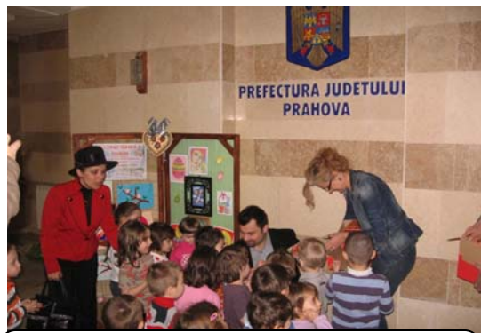
„SĂRBĂTORILE PASCALE” – expoziție și vizită la PREFECRURA Prahova.

El a fost conceput să fie realizabil printr-o Îmbinare a activităților curriculare, extracuriculare și extrașcolare într-o perioadă de patru ani. În acest caz am considerat că tema aleasă are un rol important în pregătirea socială, morală și civică a copiilor. De asemenea, am căutat să valorific cât mai bine oportunitățile alegând parteneri reprezentativi. derularea unei interesante colaborări între preșcolarii grupei mici A „Piticii năzdrăvani!”, din Grădinița „Sfinții Arhangheli Mihail și Gavriil” Ploiești cu ISJ Prahova, CCD Prahova,