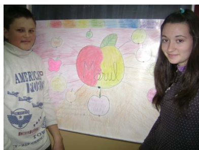
Figura 2 Activitatea „Mărul”